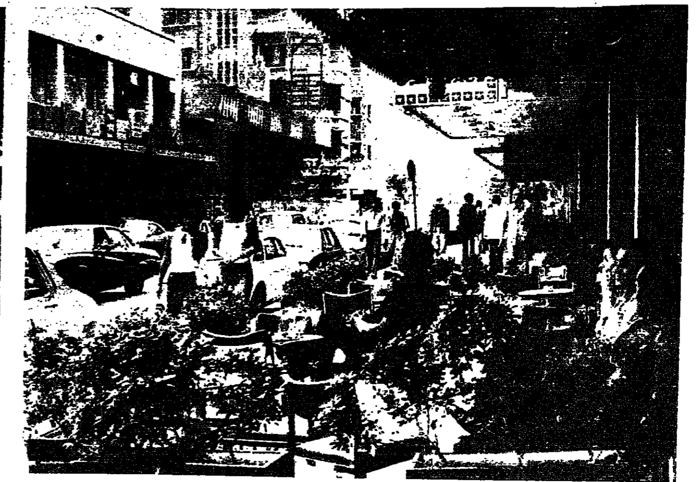
أحد مظاهر الارصفة في شوارع الجزائر - وازدادت فقط